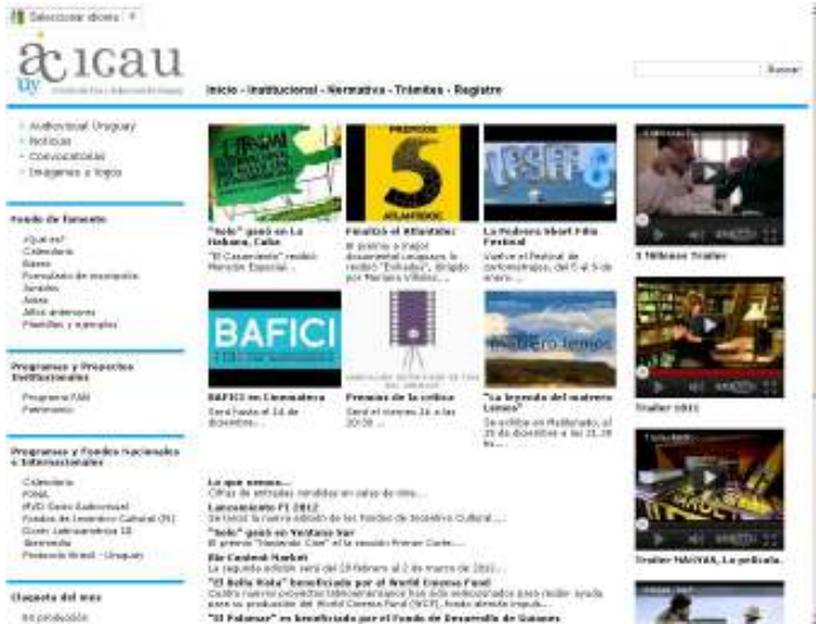
WEB ICAU 2011

La creación de una Comisión coordinada de Comunicación entre las piezas de Audiovisual Uruguay (CADU, UFC&PO, Locaciones IM, ICAU) y la efectiva integración del trabajo de búsqueda y elaboración de materiales en conjunto y en relación con otras herramientas, permitió enriquecer el trabajo en varios frentes y la integración en acciones puntuales de interés para el sector. La columna de Audiovisual Uruguay en Televisión Nacional de los días martes, y el trabajo coordinado en el Día del Cine son ejemplos en este sentido.