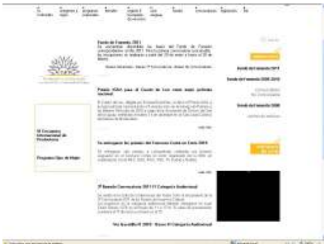
WEB ICAU 2010

Un diseño y contenido más adaptados redundan en un uso mayor y más constante, que lleva también a la necesidad de elevar el nivel de automatización en la alimentación de los datos de actualidad y de los generados en la ejecución de proyectos premiados por el Fondo, y la de los métodos de comunicación de ida y vuelta con los ciudadanos que acceden al sistema.